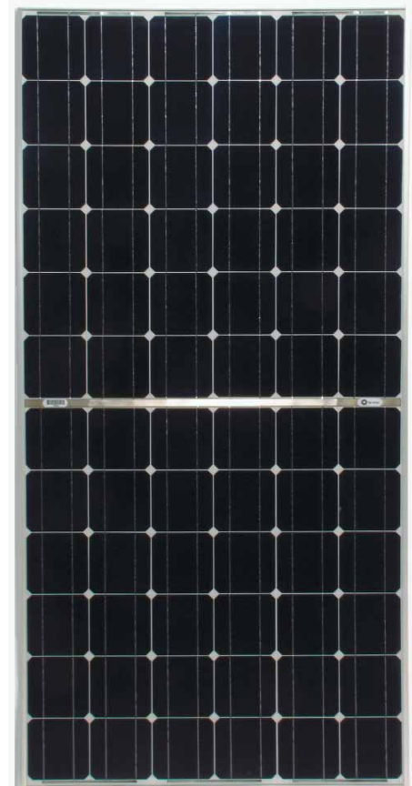
BP 7170S Maßstab 1:14

Lamine sind von "Underwriter's Laboratories" für elektrische Sicherheit und Brandschutz Klasse C anerkannt.